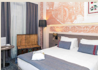
Mercure City Center 4*

15 17 17A George Enescu Street, Sector 1, 010302 Βουκουρέστι, Ρουμανία