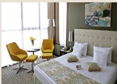
Golden Tulip Victoria 4*

166 Calea Victoriei, Sector 1, 010096 Βουκουρέστι, Ρουμανία