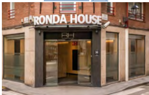
Ronda House 3* (link)